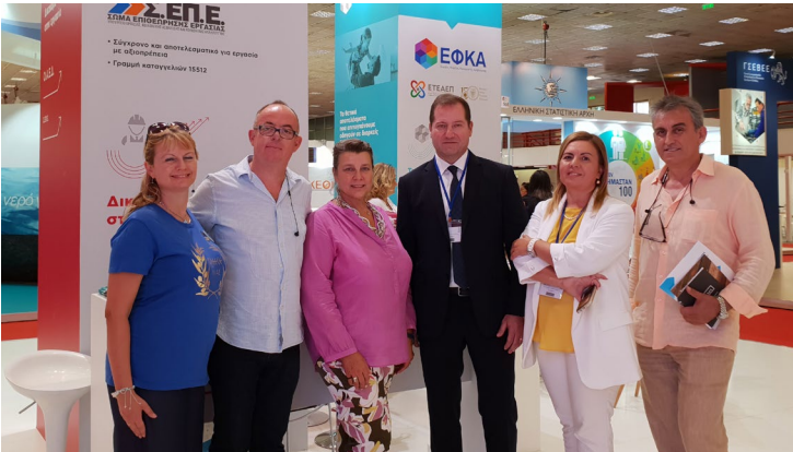
Στιγμιότυπα από τις επαφές - συναντήσεις της Διοίκησης του ΣΟΕΒ κατά τη διάρκεια της ΔΕΘ