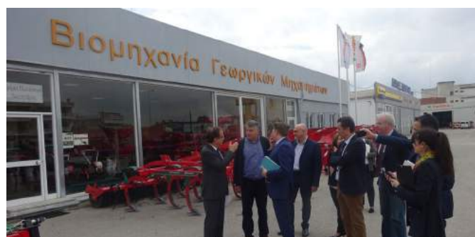
Στιγμιότυπα από τις επισκέψεις