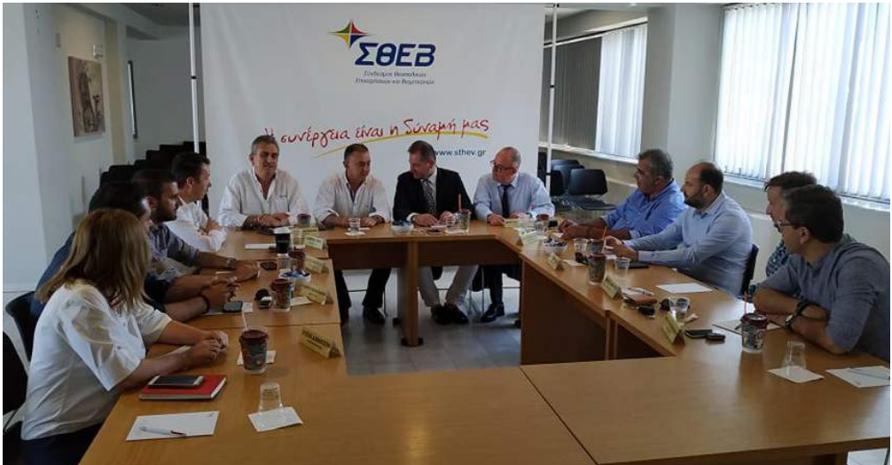
Οι υποψήφιοι Βουλευτές στον ΣΘΕΒ